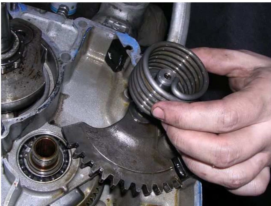
- Feder entfernen