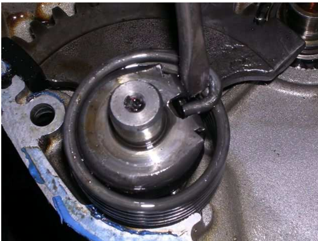
- Kickstarterfeder rausdrücken/hebeln