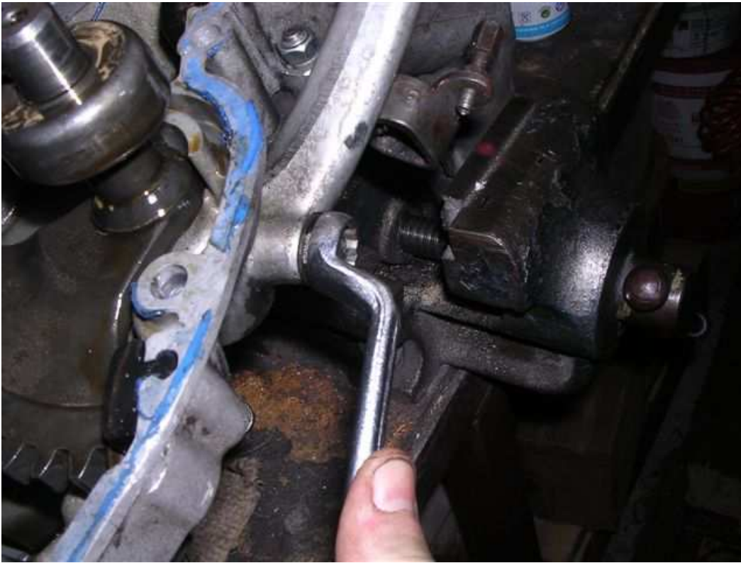
- Kickstarter abmontieren